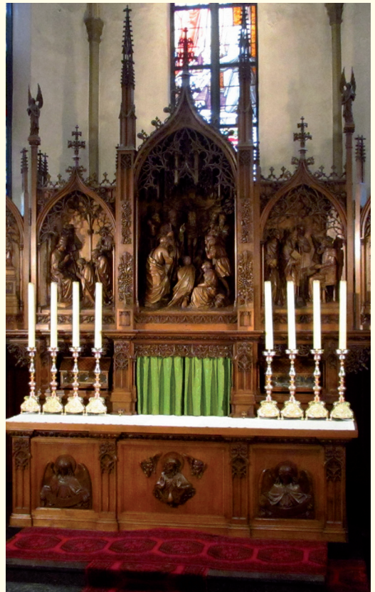
Altaarretabel boven de altaartafel in de H. Nicolaaskerk.