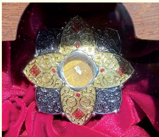
Relikwie met stukje rib.

In het rechter schrijn is op 26 mei 2022 (Hemelvaartsdag) een originele relik met een stukje rib van de H. Nicolaas geplaatst. De relik is aan Marcus Vankan geschonken door de Sint Adelbertabdij van Egmond.