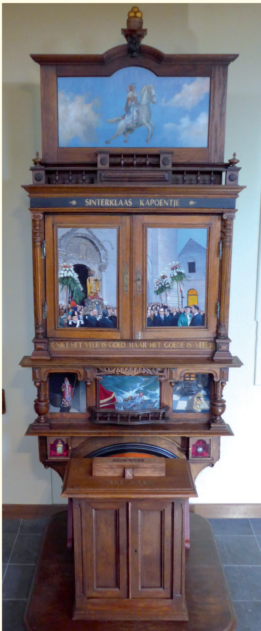
De twee deuren in het midden zijn gedurende het jaar dicht en beneden de brievenbus.

De deuren van het retabel zijn gedurende het jaar dicht en worden in de sinterklaasperiode geopend. Aan de buitenkant wordt op de dichte deuren het Sint Nicolaasverhaal verteld.