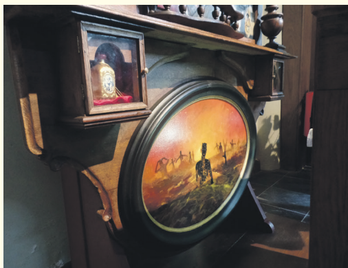
Op het ovale schilderij is de Hel afgebeeld en links een van de twee reliekschrijnen.

Daaronder volgen drie legendes. Helemaal links de opwekking van drie studenten uit de pekeltouwen en daarna het redden van een drenkeling door de staf van Sint Nicolaas; het is een zelfportret van de kunstenaar. Op het derde schilderijtje is het zetten van de schoen (klomp) vereeuwigd. Het verwijst eveneens naar de legende van de drie meisjes die een bruidsschat werd geschonken zodat ze niet in de prostitutie hoefden te gaan. Helemaal beneden achter de brievenbus is op het ovale schilderij de Hel afgebeeld; de eeuwige strijd tussen goed en kwaad.