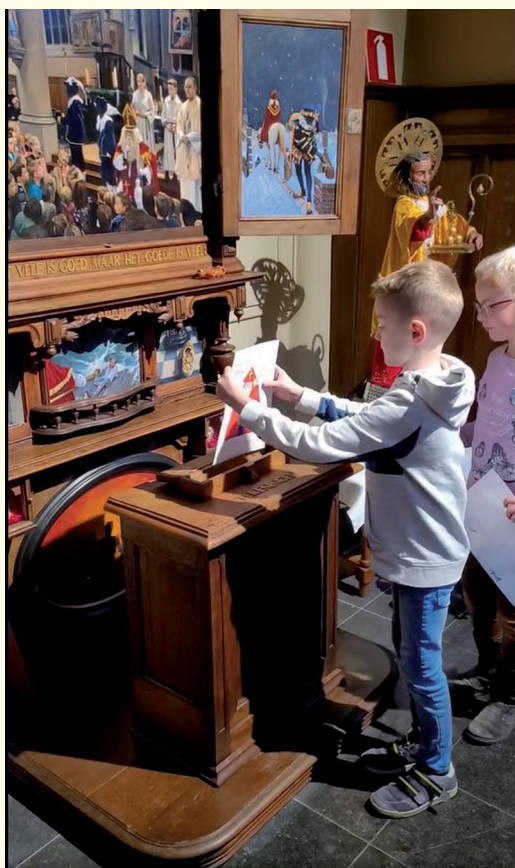
Eerste communicant stopt zijn tekening in de brievenbus.